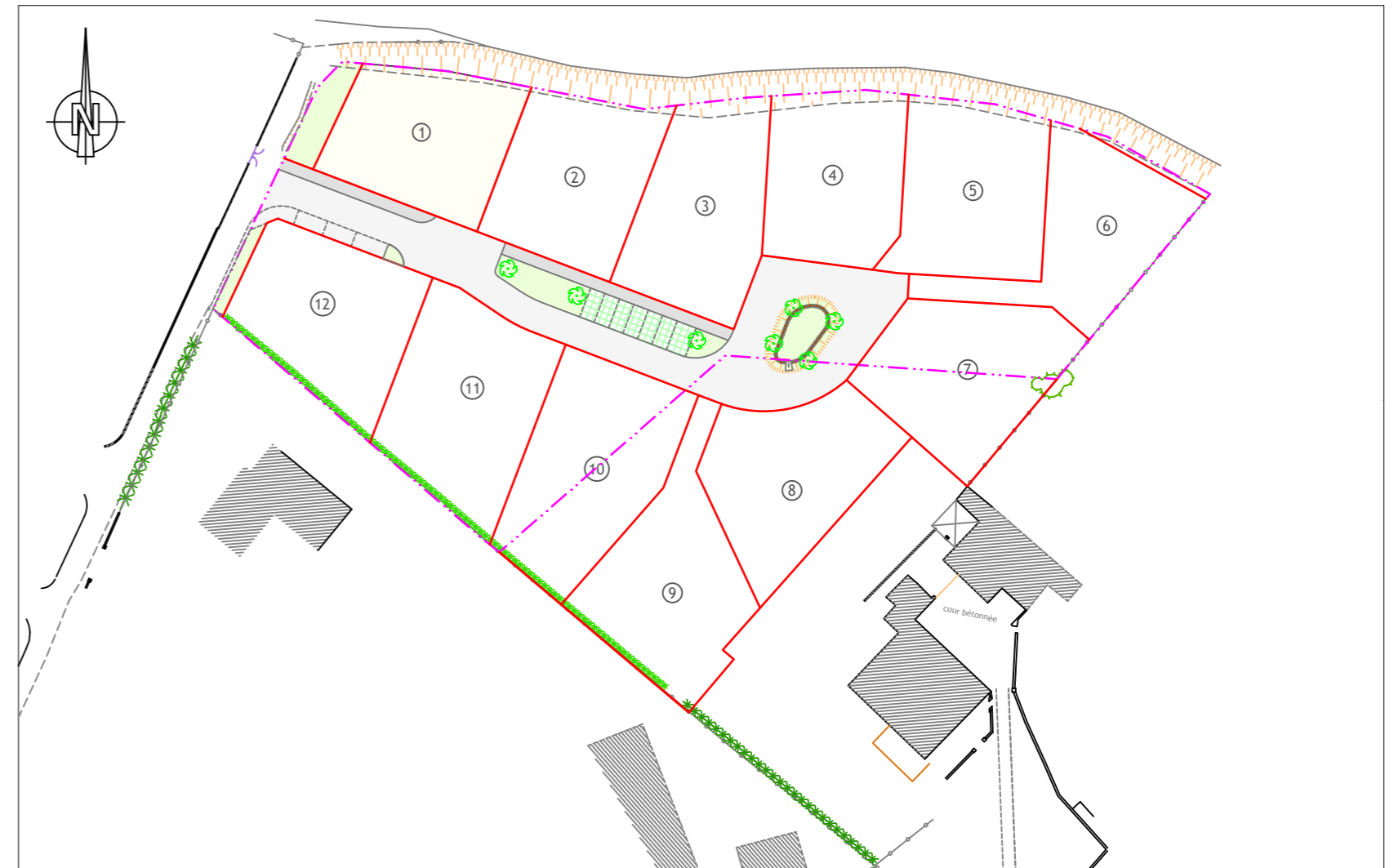
Échelle : 1 / 1000