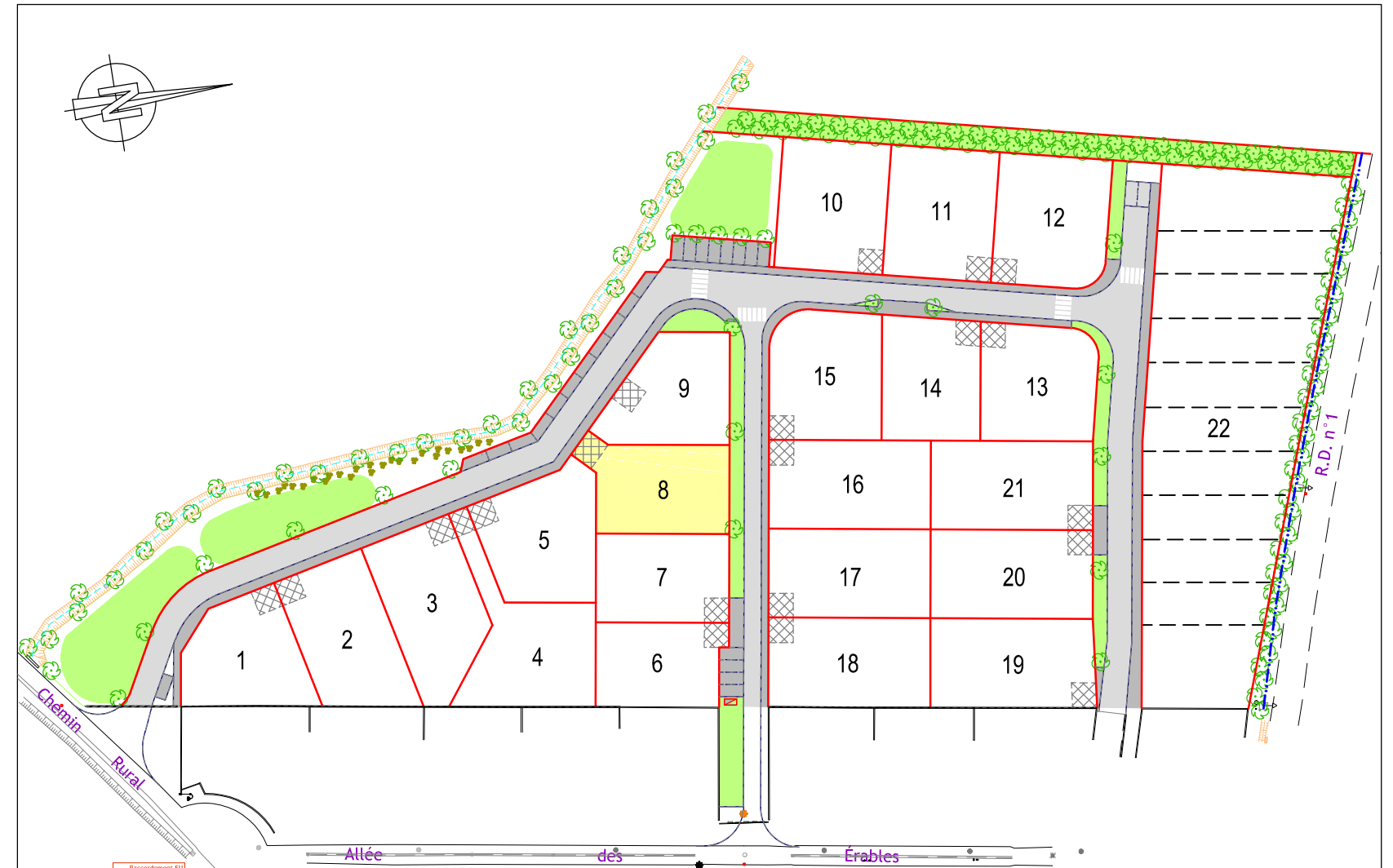
Échelle : 1 / 1250