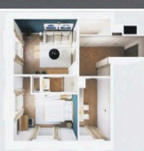
Visuels réalisés par ArchiDivers (Visite virtuelle)